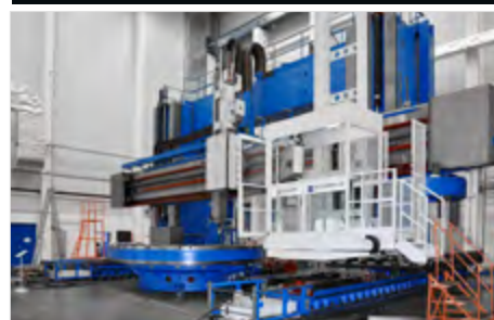
SKDY 63/80 D, Deutschland